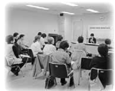
体験発表に聞き入る提供会員

月に数回お預かりしている生後3か月のNちゃん、5回目のサポートだったので、Nちゃんのことはおおかた理解しているつもりでした。ぐずってきましたが、ミルクの時間ではないし、オムツは濡れていないし…。抱っこしたけど、泣き止みません。そういえば、お母さんにいつもどうやって寝せているのかを聞いていないことに気が付きました。その日は子守唄を歌いながら立って抱っこをしました。そうしているうちに、いつの間にかNちゃんは眠っていました。後でお母さんに寝かしつけの方法について尋ねると、私の抱き方はNちゃんのお父さんと同じやり方だったことが分かり、一安心しました。