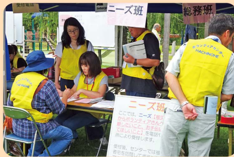
災害ボランティアセンター設置・運営訓練