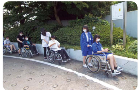
福祉の心を育む人づくり