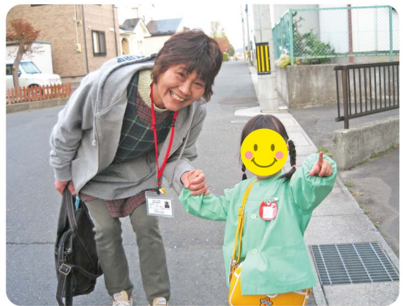
提供会員の活動の様子

提供会員は、養成講習会やスキルアップ講習会で、保育について学びながら活動を行っています。