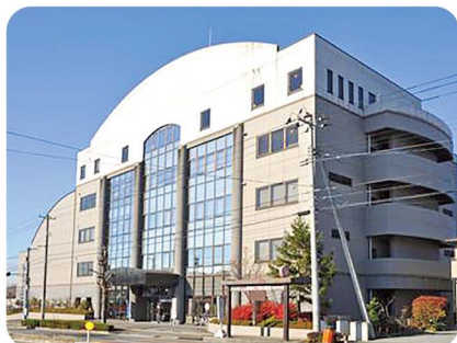
八戸市総合福祉会館