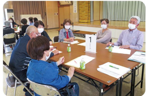
みんなで支え合う地域づくり