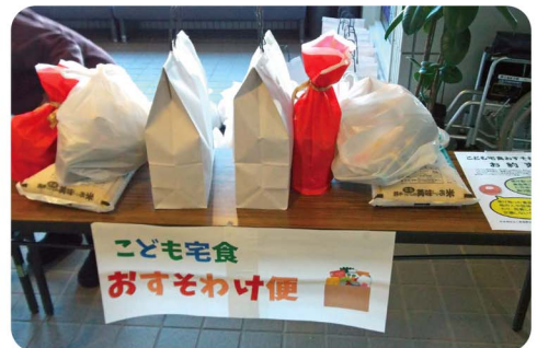
安心して暮らせる地域づくり