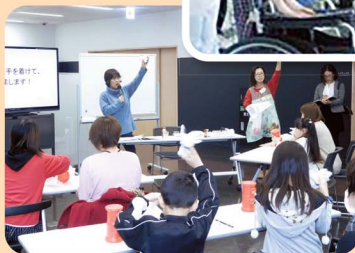
知的障がい者体験講座