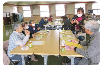
見守り活動研修会

地域住民が主体となり、小地域ごとに互いに見守り支え合う体制をつくり、一人暮らし高齢者世帯等を定期的に訪問して安否確認、話し相手となり孤独感の解消を図っています。