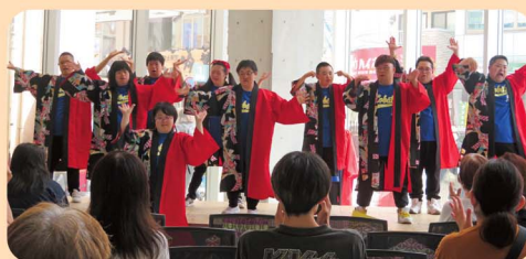
ボランティアフェスティバル