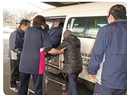
デイサービスセンター