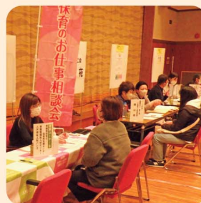
福祉の仕事と職場説明会