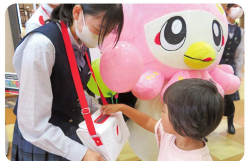
施設の運営・共同募金の推進など