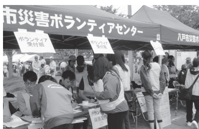
災害ボランティアセンター受付訓練の様子

※事業報告、決算報告は、ホームページに掲載しています。また、事務局でも閲覧できます。