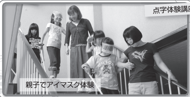
親子でアイマスク体験