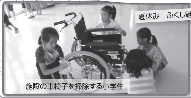
施設の車椅子を掃除する小学生