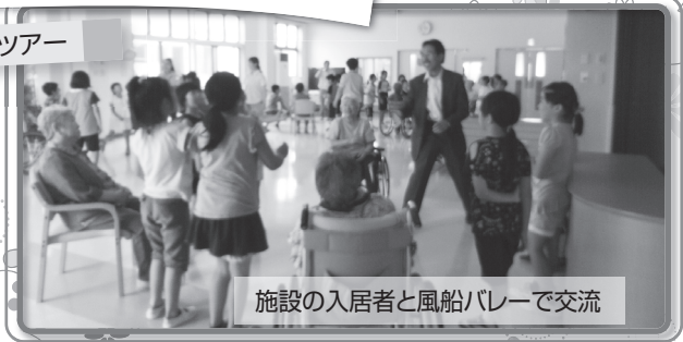
施設の入居者と風船バレーで交流