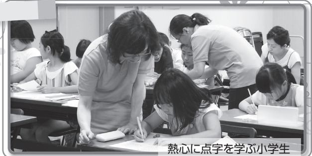
熱心に点字を学ぶ小学生