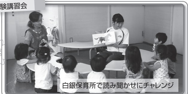
白銀保育所で読み聞かせにチャレンジ

八戸市社会福祉協議会では、未来の福祉の担い手を育成するため、夏休みにさまざまな福祉体験講座を開催しました。