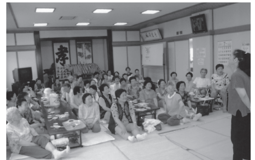
高齢者サロン「健康講座」の様子