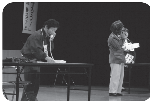
「はちのへ女性まちづくり塾生の会」の寸劇