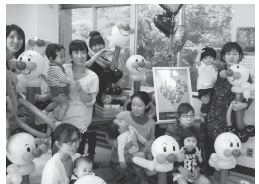
子育てサロン「バルーン作り」の様子